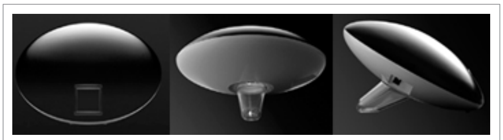
Vorderansicht mit Anzeigefläche & Berührungsfeld

Die obere Anzeigefläche und die untere Röhre können mit einem Finger durch Klopfen nach links/rechts oder oben/ unten und durch Bewegungen auf der Berührungsfläche gesteuert werden (wie ein Pinsel auf einer Farbpalette).